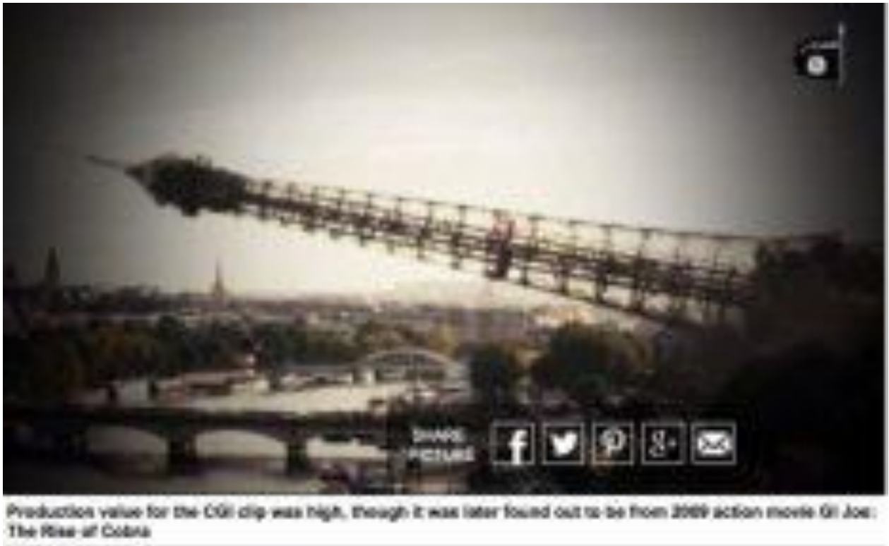
Scene van de actiefilm GI Joe The Rise of Cobra