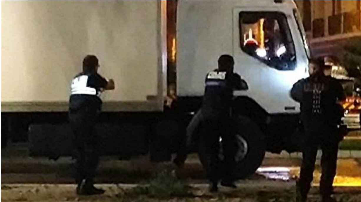
Foto's van de smetteloze vrachtwagen in Nice zonder een spatje bloed.