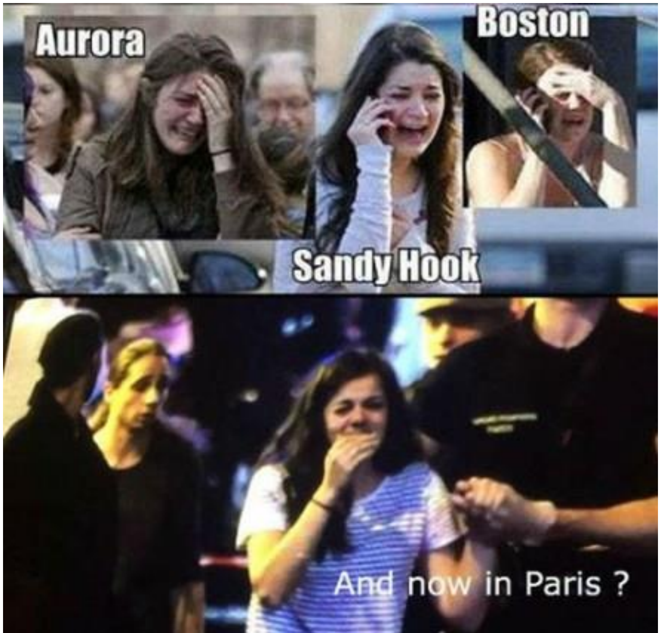
Dezelfde vrouw lijkt bij allerlei aanslagen de rol van getuige te spelen.