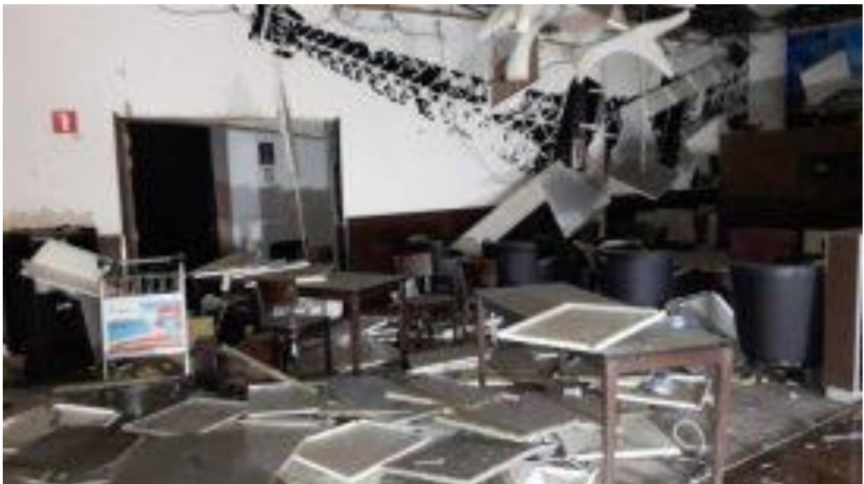
Bizarre beeld van gekapseisde Eiffeltoren in de beelden van de aanslagen op het vliegveld in Brussel

Na de aanslagen op het vliegveld in Brussel zag Ole Dammegard een rare scene in een van de uitgezonden beelden. Er werd een chaotische maar tevens desolate ruimte getoond met een muurposter van een gekapseisde Eiffeltoren. Dammegard voorspelde toen al dat een volgende aanslag in Parijs of Frankrijk zou plaatsvinden. Een opvallend detail op de dag van de aanslag in Nice is dat een brand met enorme rookvorming rond de Eiffeltoren even voor paniek zorgde. Er is wellicht een verband met de eerdere aankondiging waarvoor Dammegard en Veterans Today hebben gewaarschuwd. Misschien dat daarom een geplande aanslag in Parijs is verplaatst naar Nice of er is sprake van een mislukte aanslag in Parijs die gelijktijdig had moeten plaatsvinden.