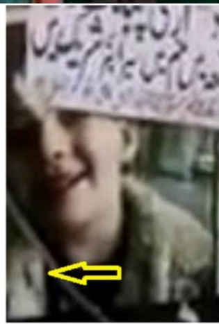
Dit slachtoffertje 'stierf' zowel bij de Sandy Hook schietpartij in de VS (bovenste foto's) en 'stierf' een tweede keer in Pakistan als gevolg van een schietpartij door de Taliban (onderste foto's).